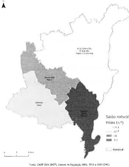
Figura 4 – Saldo natural médio por freguesia (2001, 2011 e 2021)

No Município de Alandroal, a taxa de crescimento migratório tem seguido praticamente a mesma tendência do Alentejo e do Alentejo Central, registando, entre 2014 e 2021, uma tendência crescente. Este aumento foi mais acentuado desde 2018, apesar do ligeiro decréscimo em 2020. Em 2021, registou-se neste município uma taxa de crescimento migratório de 1,29% (Figura 5).