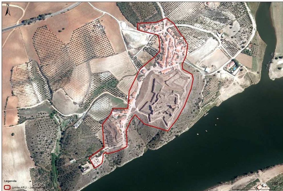
Figura 3.1 | Planta de proposta de delimitação da ARU