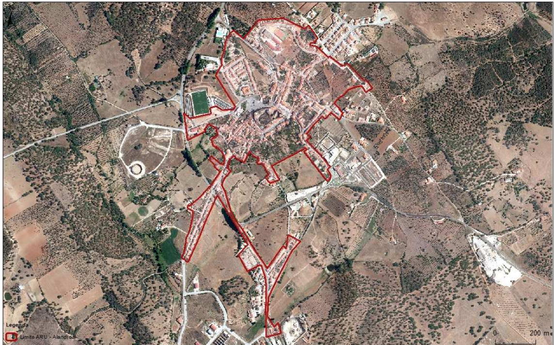
Figura 3.1 | Planta de proposta de delimitação da ARU